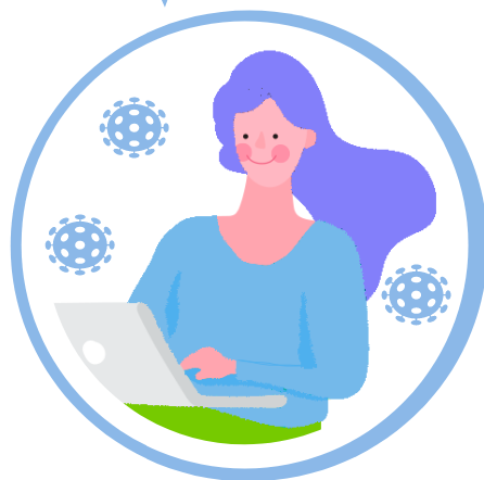
ЛЕГКОЕ ТЕЧЕНИЕ COVID-19 В СЛУЧАЕ ЗАРАЖЕНИЯ